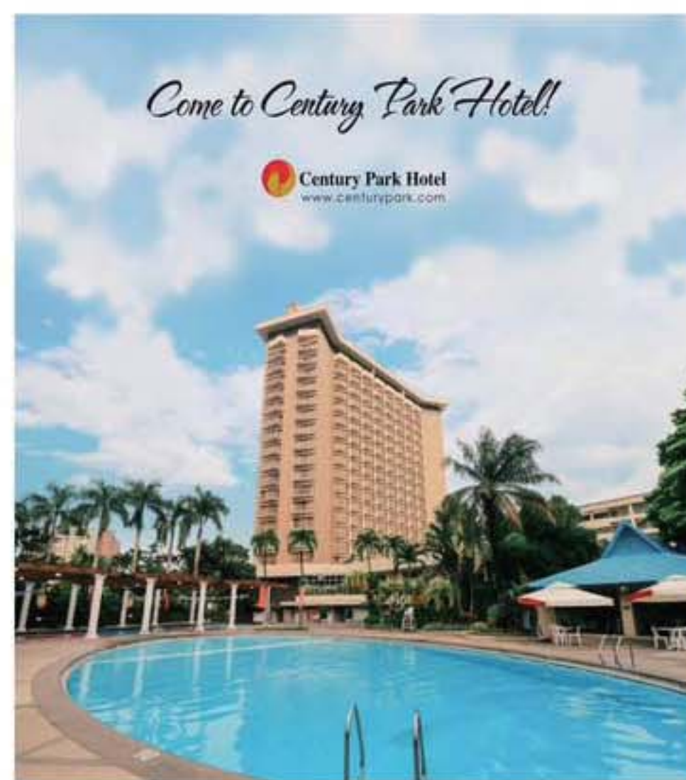
Century Park Hotel